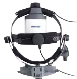
All Pupil II с настенным держателем