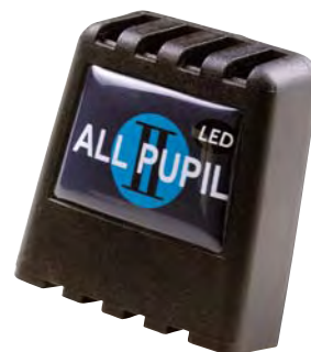
All Pupil II LED