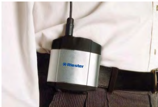
Переносной комплект аккумуляторов для проводного All Pupil II

С настенным держателем и проводным электропитанием для стационарного применения, переносной вариант с мощным аккумулятором, закрепляемым на ремне или полностью беспроводное исполнение для абсолютной свободы передвижения без компромиссов. В этой версии сбалансированный литийионный аккумулятор закреплён на задней стороне налобной ленты. Для максимального комфорта и сохранения полной яркости света.