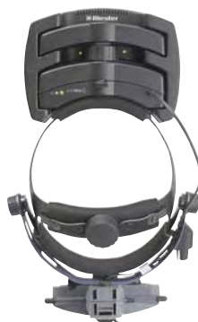
Беспроводной All Pupil II